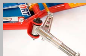
新型アライメントアジャスター