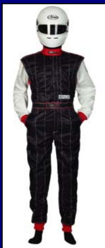
シャイニングブラック&シャイニングホワイト(LE-710)

四輪FIAモデルと同じシャイニング系ノーメックスを採用、スーツがエレガントに輝きます。耐火性能とカッコ良さを追求した究極のカートスーツです。四輪のファンドライブでもお使い頂けます。