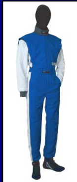
ブルー&ホワイト(LE-522) * ニット部はダークグレー