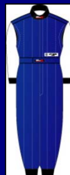
シャイニングブルー&シャイニングホワイト(LE-712)