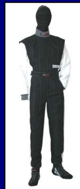
ブラック&ホワイト(LE-523) * ニット部はダークグレー