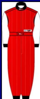
シャイニングレッド&シャイニングホワイト(LE-711)