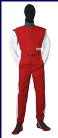
ダークレッド&ホワイト(LE-521) * ニット部はダークグレー