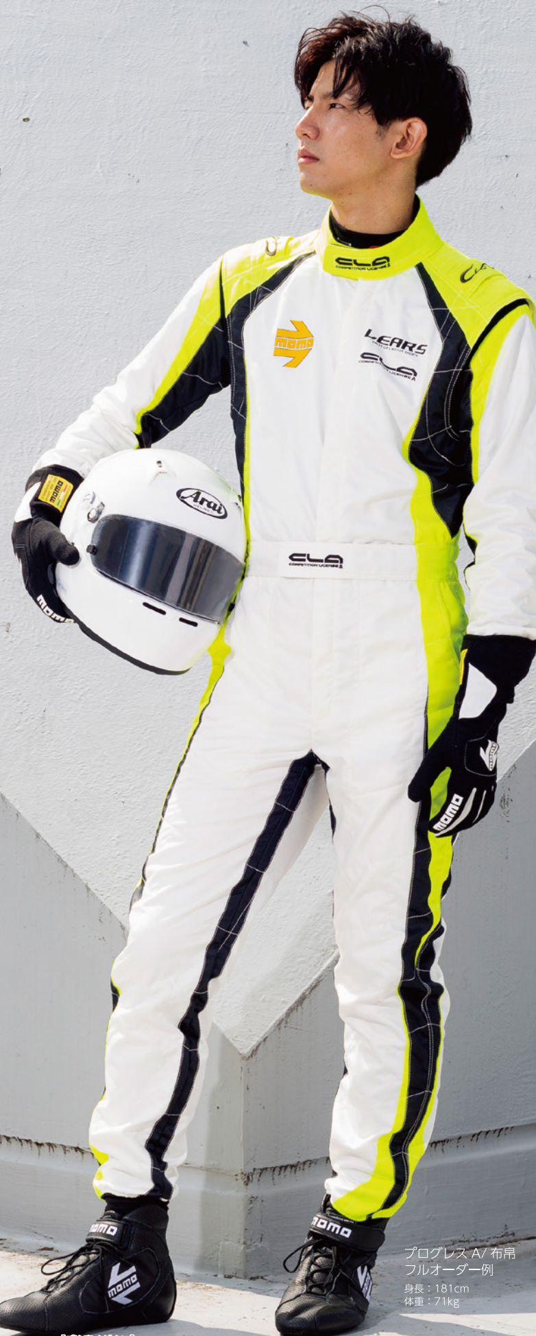
プログレス A/ 布帛 フルオーダー例 身長：181cm 体重：71kg

MANUFACTURER: LEARS MODEL: PROGRESS A HOM. NO: RS.283.16 FIA STANDARD: 8856-2000