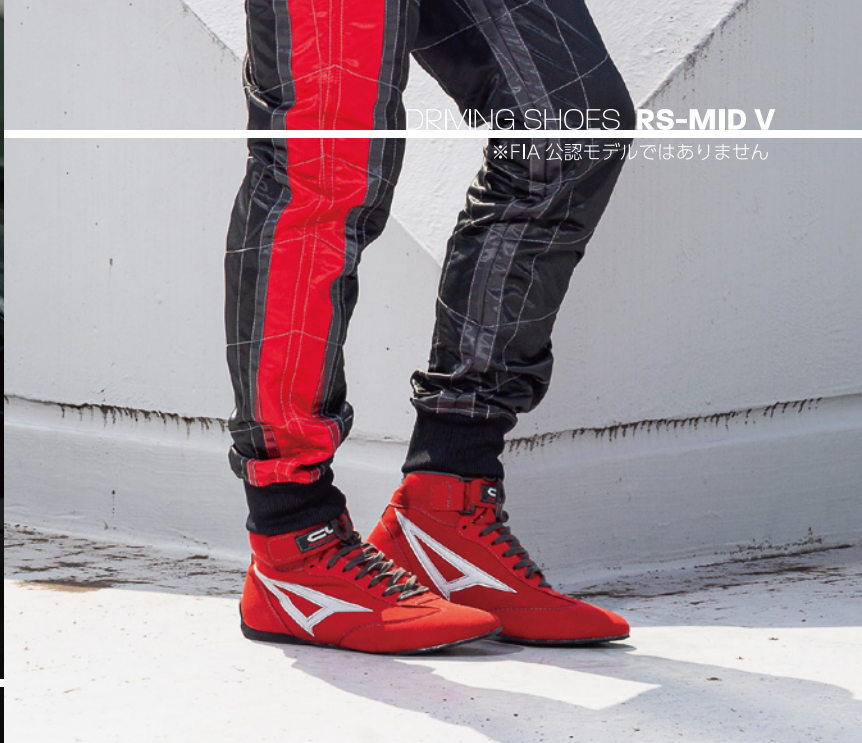
DRIVING SHOES RS-MID V