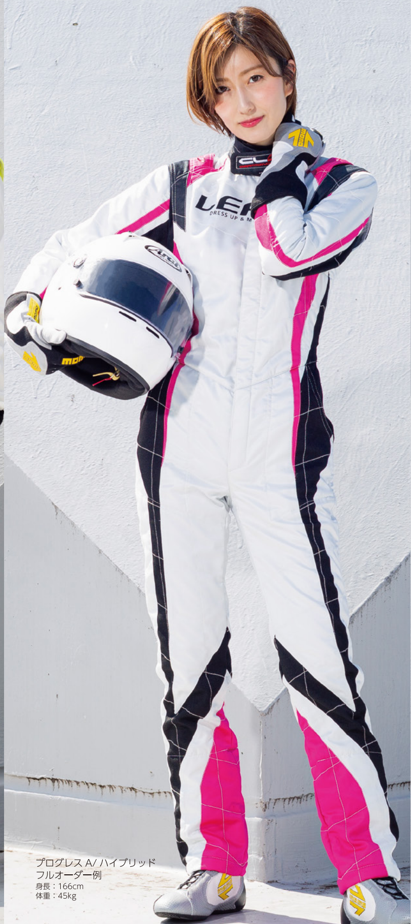
プログレス A/ ハイブリッド フルオーダー例 身長：166cm 体重：45kg